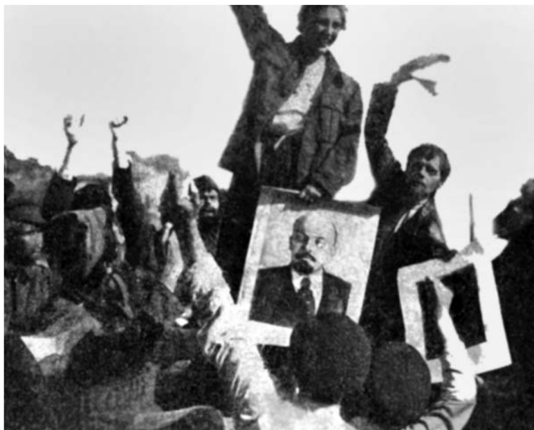
«Красный газ». Финальный кадр