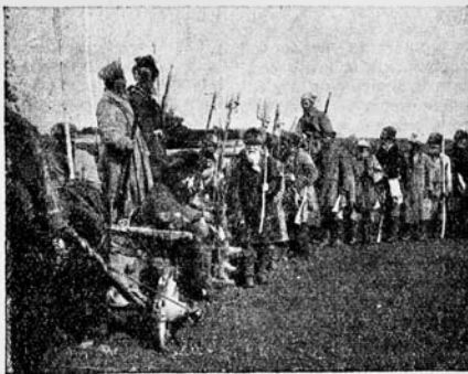
Из фильма «Красный газ». Серебряная рота выступает на позиции.

которые, действительно, много погибло в Сибири. Освобождение