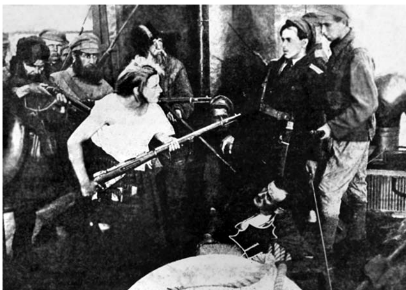
«Красный газ». Кадр из фильма

Так вот — первый художественный фильм был снят в Новосибирске и с успехом прошел по киноэкранам страны в 1924 г. и был назван «лучшим достижением советской кинематографии». 13 декабря 1924 г. газета «Правда» печатает заметку: «С пятницы 12 декабря в госкиноотеатрах идет картина производства Сибгоскино “Красный газ” из жизни партизан в Сибири в период борьбы с Колчаком. Картина на просмотре представителей печати и Главполитпросвета заслужила одобрение и последним рекомендована как “лучшее достижение советской кинематографии”». Днем раньше фильм вышел на экраны новониколаевских кинотеатров, и за два дня его посмотрели более семи тысяч человек. В городе шли общественные обсуждения, дискуссии, встречи с участниками съемок. А полтора года спустя местная газета, ссылаясь на сведения из Москвы, сообщает: «Сибирская фильма “Красный газ” имеет огромный по сравнению с другими фильмами тираж в 53 копии против 25—30 других картин. По успеху она уступает лишь фильму “Красные дьяволята”».