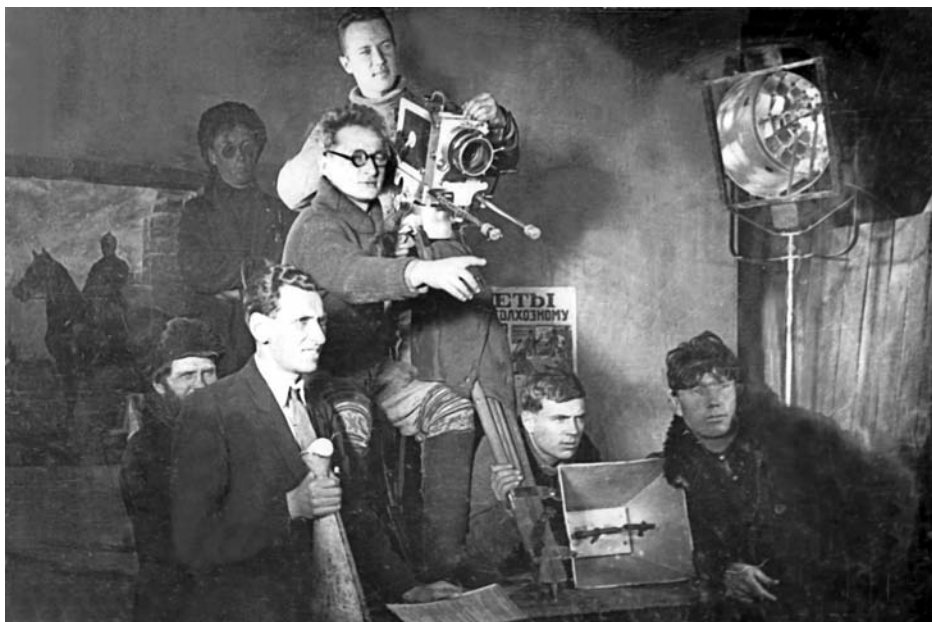
Съемочная группа короткометражного художественного фильма «Баррикада». 1931 г.