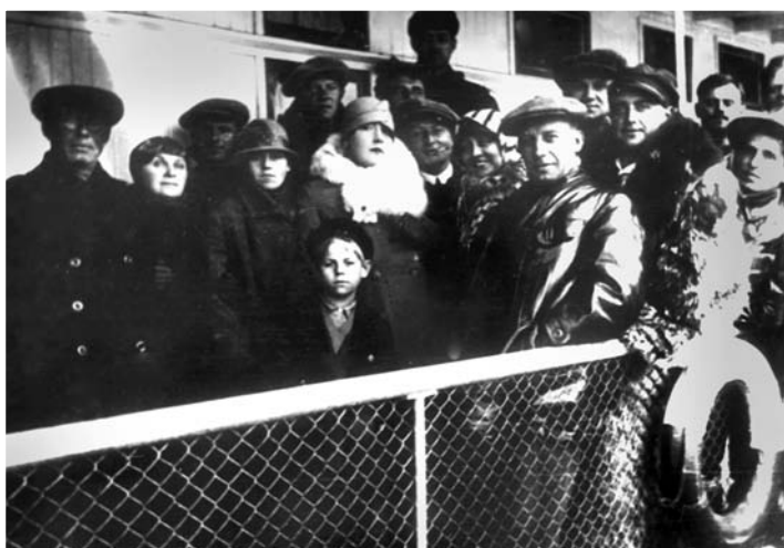
Съемочная группа художественного фильма «Огненный рейс». 1930 г.