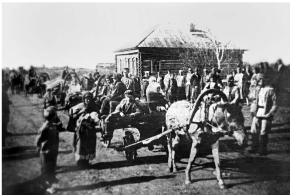
«Конец Журавлихи». Кадр из фильма