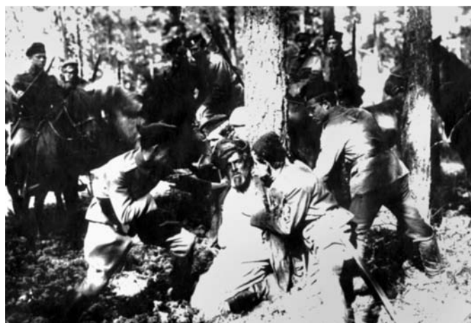
«Красный газ». Кадр из фильма. В роли крестьянина — режиссер Иван Калабухов