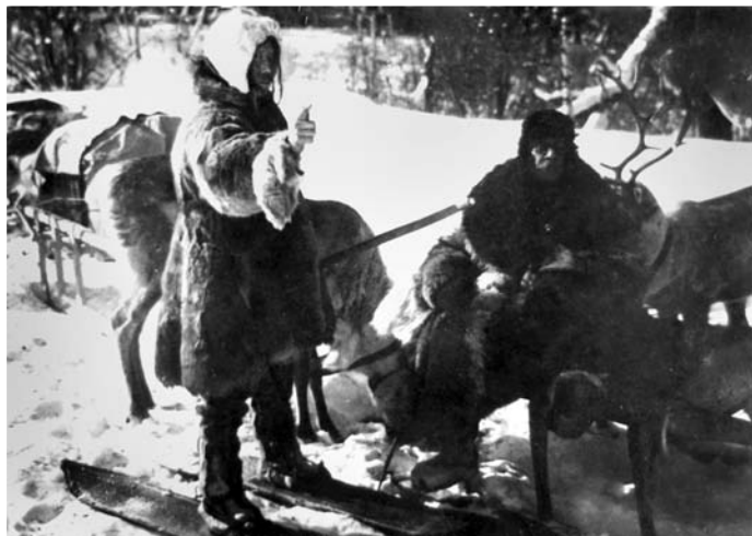
«Тунгус с Хэнычара». Кадр из фильма