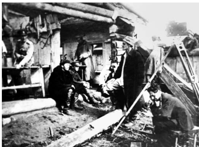
Рабочий момент съемок фильма «Красный газ». 1924 г.