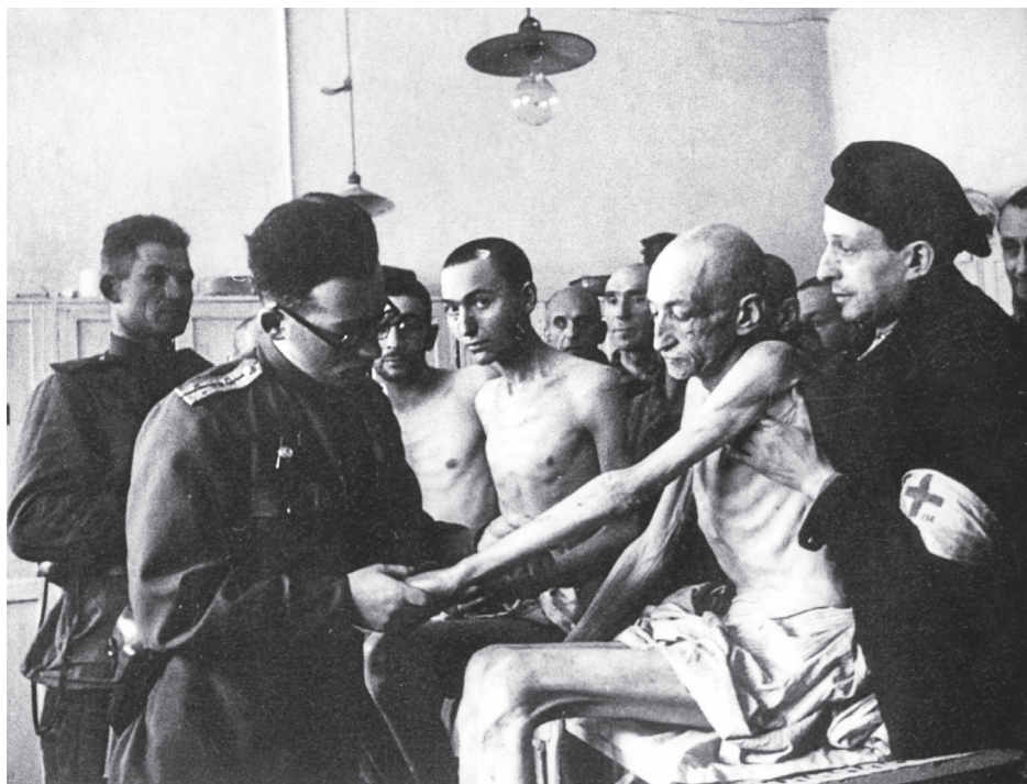
Осмотр бывших узников советскими врачами. 1945 г.