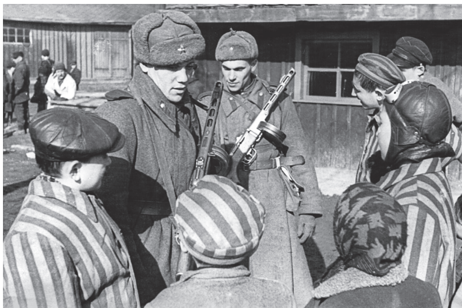
Освобожденные узники Освенцима беседуют с бойцами Красной армии. Освенцим. 1945 г.

В одном из складов натолкнулись на груды мыла, к которому никто из освобожденных не притрагивался: это мыло, приготовленное нацистами из человеческого жира. В “жилых” бараках лежат, иногда стоят истощенные, измученные,